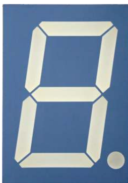
Abbildung in Originalgröße