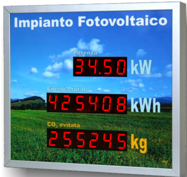
BasicLineS, IP20/IP65, Standard-Gehäuse